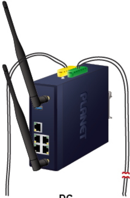
DC Power Failure